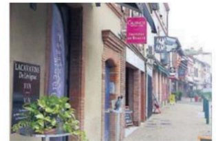
La balle est dans le camp des commerçants

Un projet innovant est en cours, à l'initiative de l'association APEEL (association des parents d'élèves des écoles de Lévig nac) et qui a, dans sa phase préparatoire, le soutien de la municipalité. Ce projet qui devrait favoriser les commerces de proximité de Lévig nac, consiste à la mise en place d'une carte village, dont chaque foyer lévig nacais pourrait se porter acquéreur, et dont les recettes participeraient au financement des sorties scolaires des deux écoles de la commune. Cette carte permettrait d'obtenir auprès des commerçants du village, partenaires de l'opération, des avantages lors des achats. Pour les porteurs du projet : « La carte serait un vecteur du lien social entre les habitants de Lévig nac et les acteurs commerciaux de la commune, elle pourrait fidéliser les clients, rendre le village encore plus vivant en créant du lien entre les habitants et les commerces de proximité ». Suite à la première réunion pour consolider ce projet de carte village, de nom-